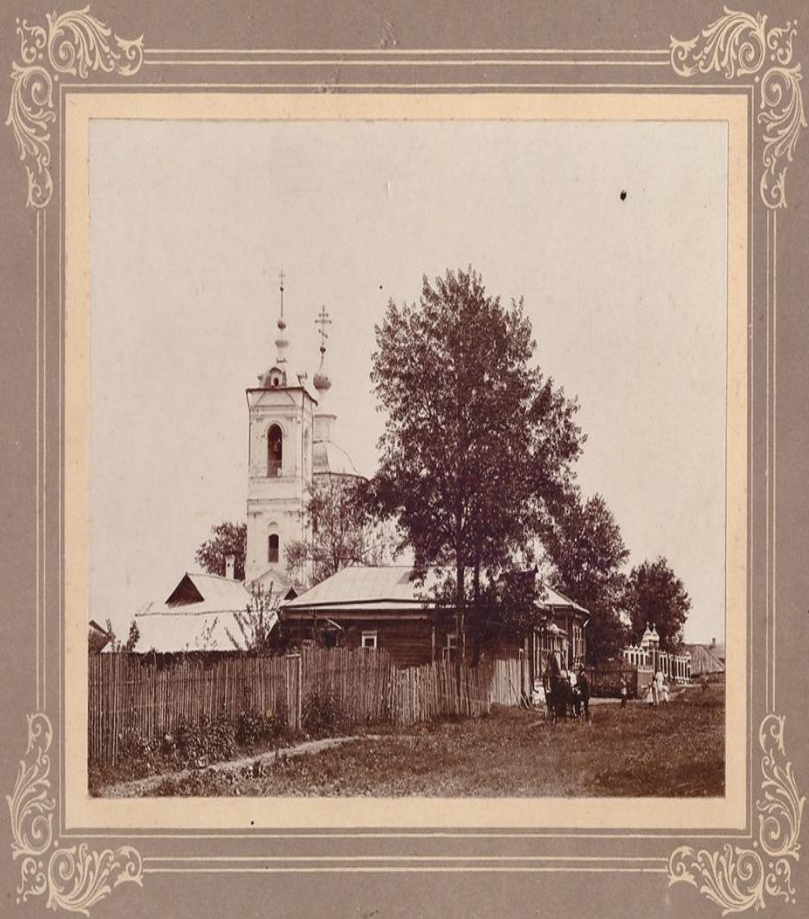
Дмитров. Васильевская церковь.